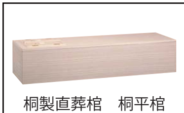
桐製直葬棺 桐平棺

役所手続き、火葬場手続きは無料にて行いますので、故人とのお別れに時間をお使い頂けます